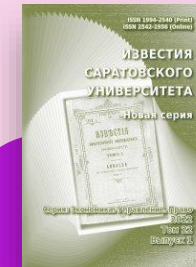
Известия Саратовского университета. Серия «Экономика. Управление. Право»