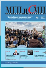
Актуальные проблемы МГП и СМИ