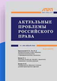
Актуальные проблемы Российского права