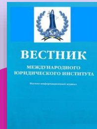
Вестник Международного юридического института